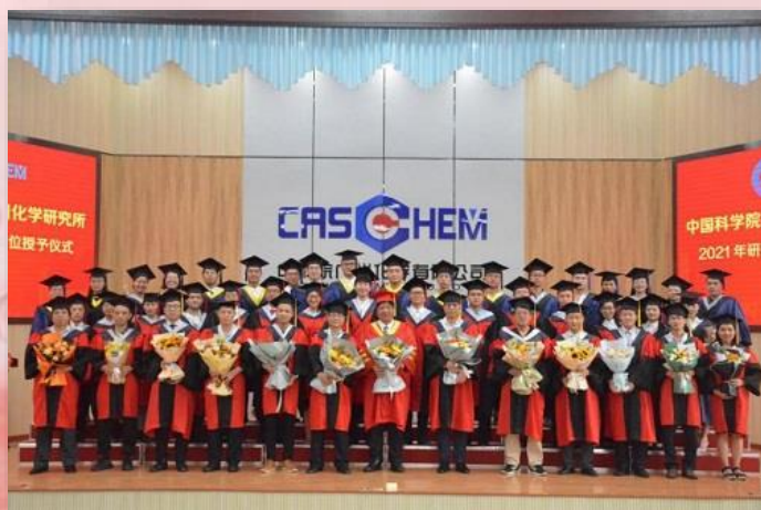
广州化学学位委员会成员、导师代表与毕业生合影留念